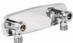
Blandarfäste för utanpåliggande rördragning

Klicka dig vidare på alternativet som stämmer för att bläddra bland vårt utbud av blandarfästen!